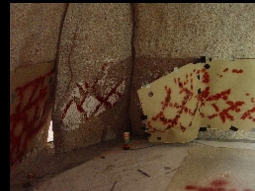
Integración de plantillas para las pinturas, digitalizadas de calcos obtenidos y cortadas a láser co2