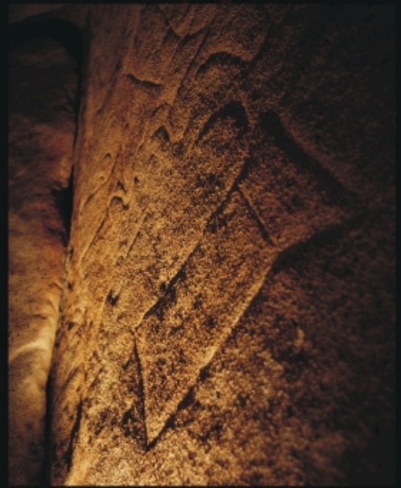
Detalle Petroglifos "The Thing"