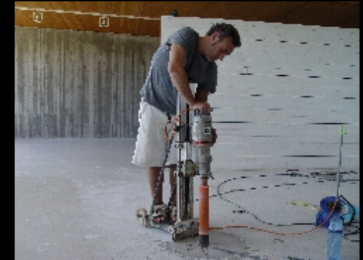
Ubicación de huecos para instalación de luminarias y anclaje