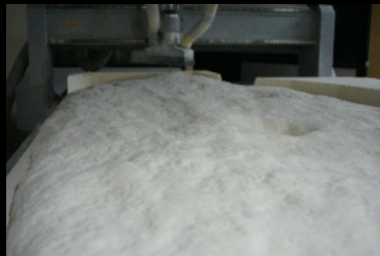
Mecanizado 3D sobre espuma de poliuretano HD