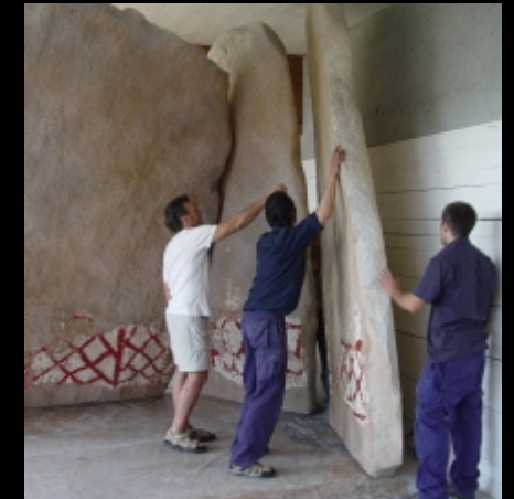
Instalación del conjunto