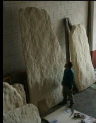
Unión y repaso de piezas