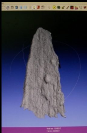
Creación y exportación de Mallas individuales