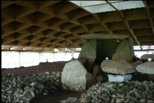
Escaneado láser sin contacto del Monumento a tamaño completo